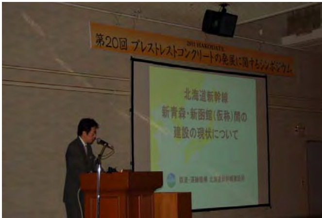
(独)鉄道建設・運輸施設整備支援機構 北海道新幹線 新青森・新函館(仮称)間の 建設の現状について