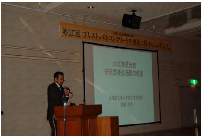
北海道大学 JCI北海道支部 研究委員会活動の概要