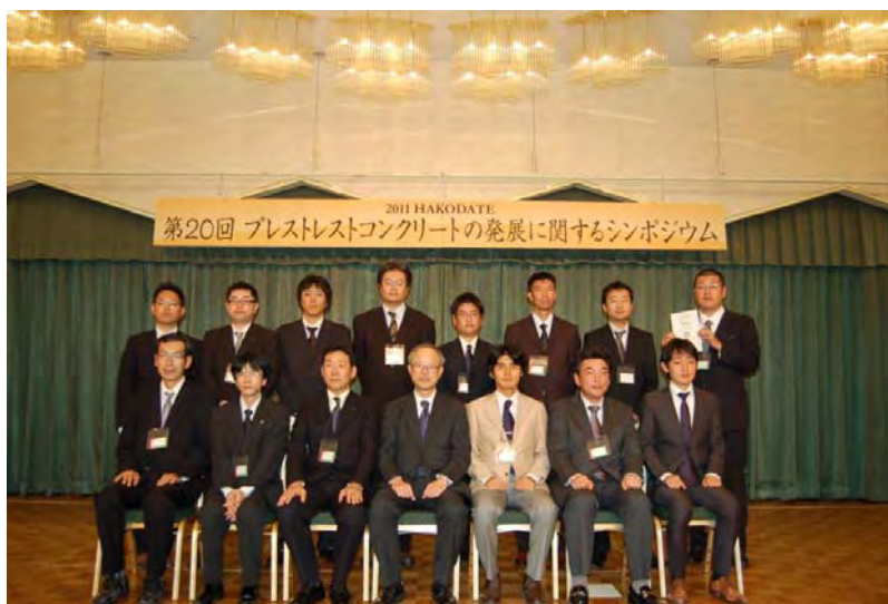
優秀講演者記念撮影 (閉会式後)