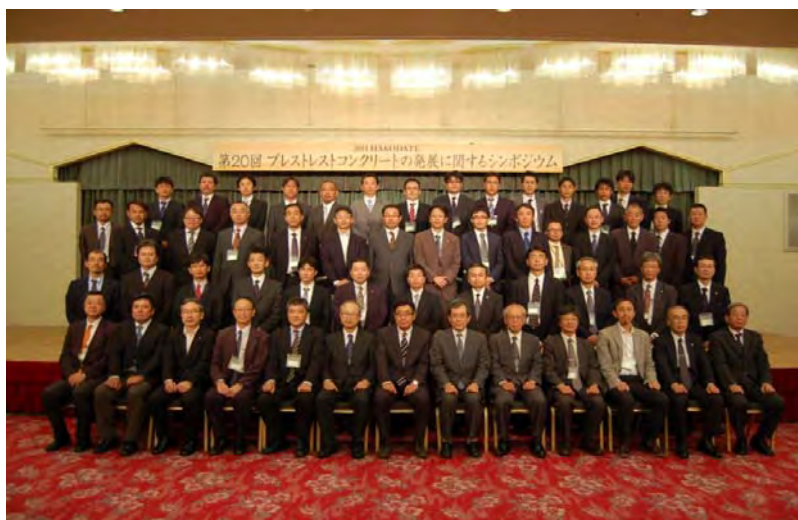
スタッフ集合写真 (閉会式後)