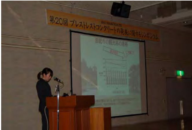
(独)土木研究所 寒地土木研究所 道南支局 函館土木・産業遺産フットパス ～フットパスによる道南地域の土木・産業 遺産の活用に関する現状と課題～