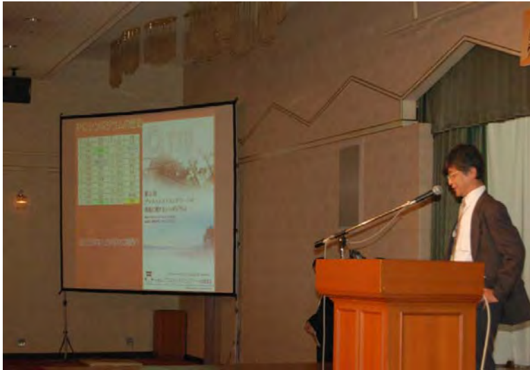
大津シンポジウムへのお誘い シンポジウム実行委員会 委員 井上 晋