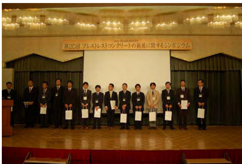
優秀講演者の表彰