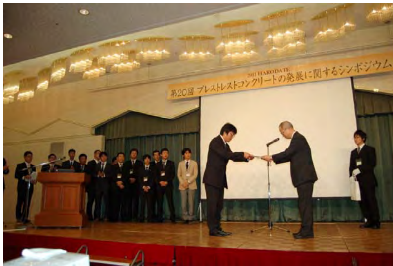
優秀講演者の表彰