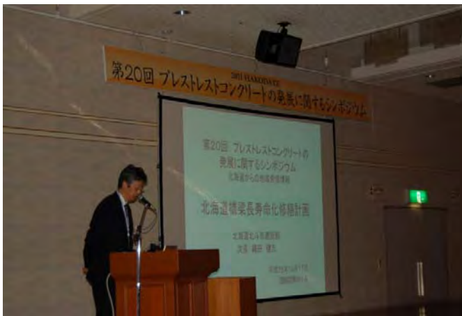
北海道北斗市 北海道橋梁長寿命化修繕計画