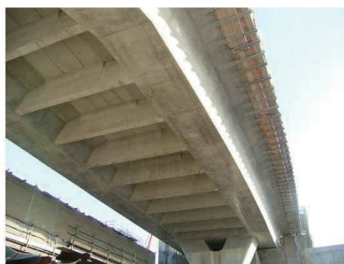
写真-6 横取り完了後の桁下全景