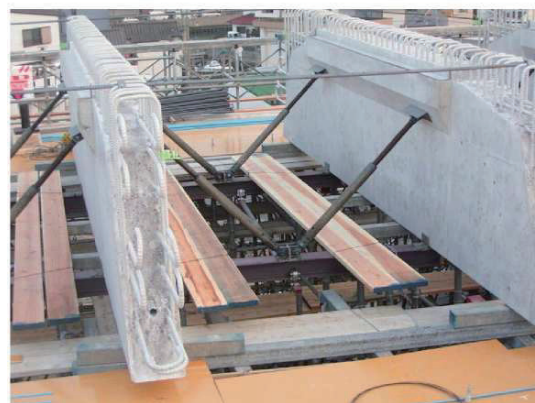
写真-2 転倒防止措置