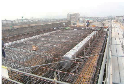
写真-4 床版上筋組立前の状況

コンクリート打設はポンプ車2台により主桁部(早強)と床版部(膨張材入り)を2日に分けて行った。床版上筋組立前の状況を写真-4に示す。