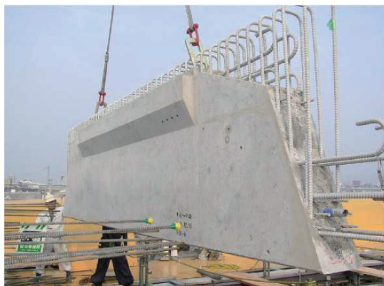
写真-1 プレキャスト横リブ

プレキャスト横リブは、PC鋼材8本-1S15.2を使用したプレテンション方式の工場製品である。PC板も標準サイズが2090×1000×75の工場製品であり、PC鋼材は1S9.3を使用した。主桁と横リブは、張出鉄筋(D25) + 横締め(1S21.8グラウトタイプ)により接合を行った。プレキャスト横リブを写真-1に示す。