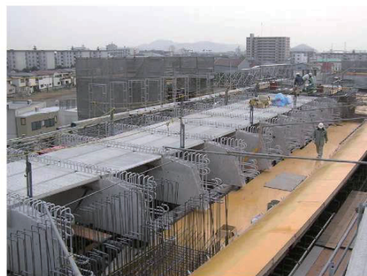
写真-3 横リブ・PC板架設完了状況