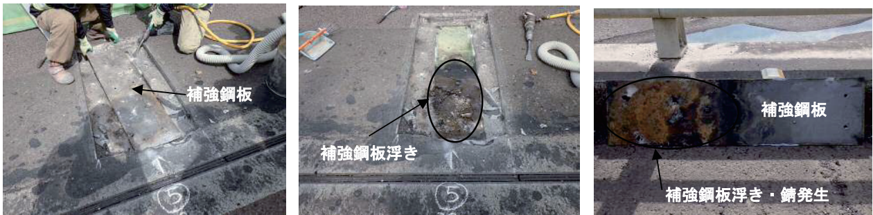
写真-6 微破壊検査状況

結果は、すべての箇所において鋼板の浮きのみで、床版コンクリートについての損傷は皆無であった。