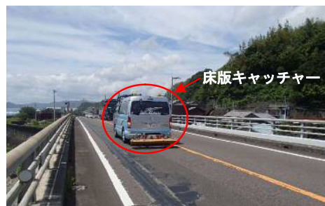
写真-5 非破壊検査状況

非破壊検査の結果、埋設補強鋼板の配置確認はできたが、床版コンクリートの損傷状況確認は不可能であった（図-