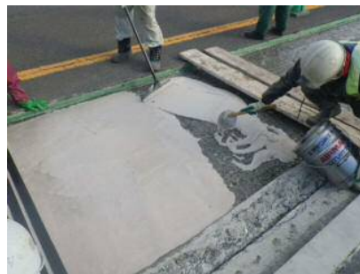
写真-11 断面修復状況