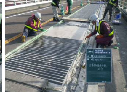
写真-12 炭素繊維補強状況