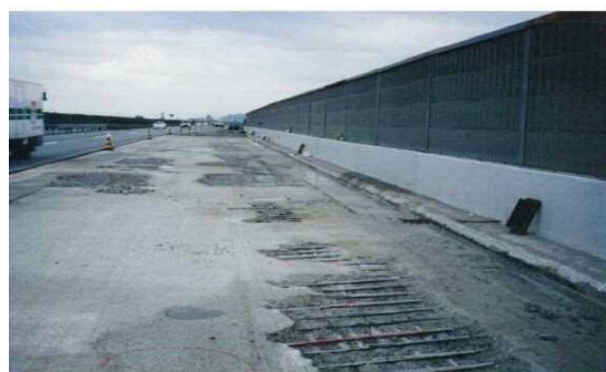
写真-2 床版コンクリートの浮きの例

現況確認として有井川橋の目視確認を行ったが、床版コンクリートの状況については舗装下のため、確認が不可能であった。舗装損傷の原因が、鋼板の浮きだけとは限定できず、床版の損傷として、床版コンクリートの浮き（写真-2）、床版鉄筋の腐食（写真-3）、床版コンクリートの抜け落ち（写真-4）などが考えられた。万が一、床版の損傷があった場合、その損傷状況により工程や使用材料に大きな差異が生じ、工期および工費の増大する可能性があった。