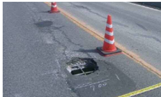
写真-4 床版コンクリートの抜け落ちの例