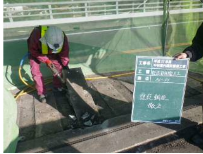
写真-8 既設鋼板撤去状況