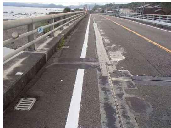
写真-1 舗装損傷状況

有井川橋は、平成10年度に橋梁拡幅工事にあわせて鋼板による床版補強工事が実施されたが、舗装の異常が比較的早い段階から認められ、舗装の補修が繰り返し行われていた。平成23年度には補修工事の一環として損傷部の舗装を一部撤去し床版上面の確認を行った結果、床版上面に設置された補強鋼板の浮きが確認されている。本工事の施工計画を作成する前に現場状況を把握するため現況確認を行ったが、舗装の浮き・割れなどが数か所で見受けられた（写真-1）。