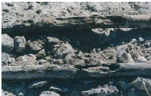
写真-3 床版鉄筋の腐食の例