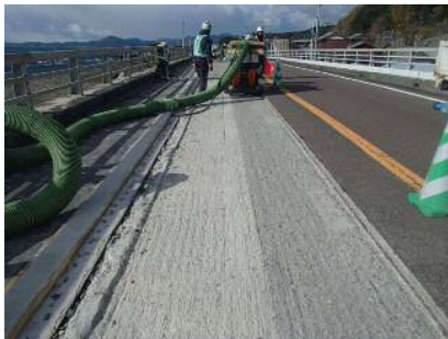
写真-10 下地処理状況

エポキシ樹脂モルタル硬化後、橋面防水（シート防水）に続いてアスファルト舗装を行い、施工を完了した。