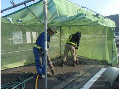
写真-7 舗装撤去状況

既設補強鋼板の撤去後、切削機を使用して、床版コンクリートを深さ1cmで切削した（写真-9）。