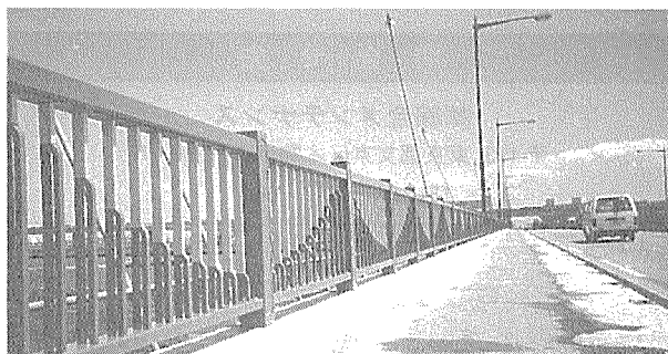
写真-2 平井大橋 (首都高速道路公団)