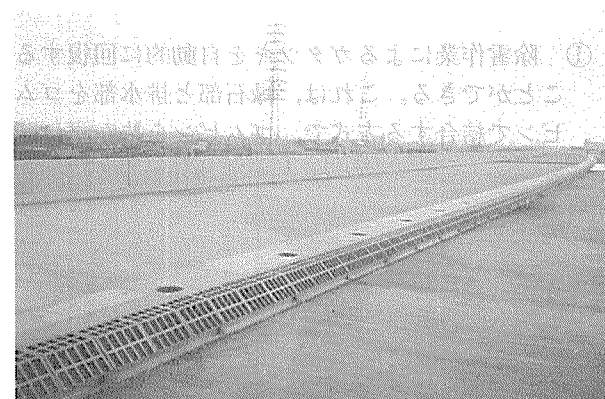
写真-2 中央分離帯用

型製作することにより、複雑な形状にも対応でき、大量生産も可能である。また、材質は球状黒鉛鑄鉄品 (JIS G 5502) とすることにより十分な強度を有する部材が確保される。このことは、所要の設定荷重に対応できることはもちろん、輸送運搬中の強度も保証することとなる。