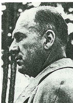
写真-3 フリッツ・トット