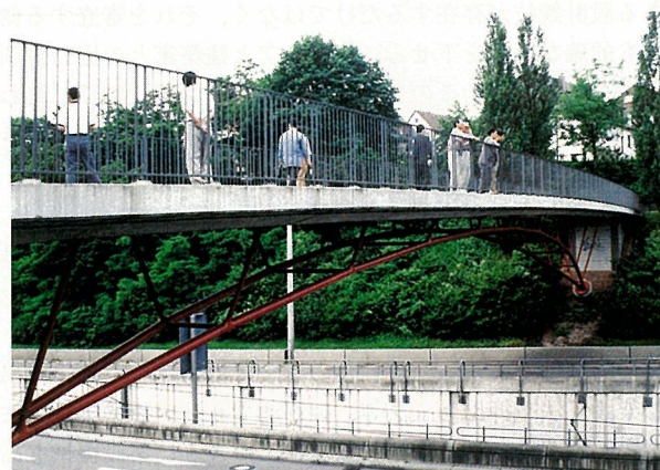
写真-10 プラークザッテルの歩道橋, 1992