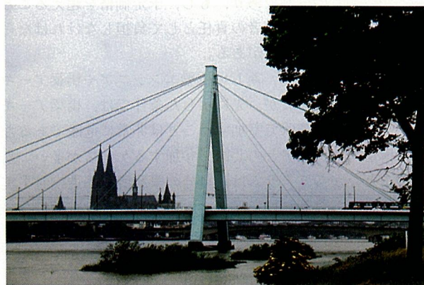
写真-7 ゼフェリンス橋 (ケルン)

戦後、とくに1950年代にケルンやデュッセルドルフにおいてこれまでにない新しい構造形式として斜張橋が出現する (写真-7)。船運に支障なくライン川を渡るためには、中央スパンは少なくとも240m~260m、しかも幅員 (全幅) は27m~35mを有する広幅員の橋梁が必要とされた。このように大規模な橋梁については必ず設計競技が行われていた。設計競技においてエンジニアと建築家が共同で応募することが頻繁に行われたのは、両者が計画の上位からコンセプトづくりをすることが設計競技に勝つための鍵でもあったからである。最低価格の案が必ず優勝するという定式は存在せず、多少高くても、構造的にもデザイン的にも新規性