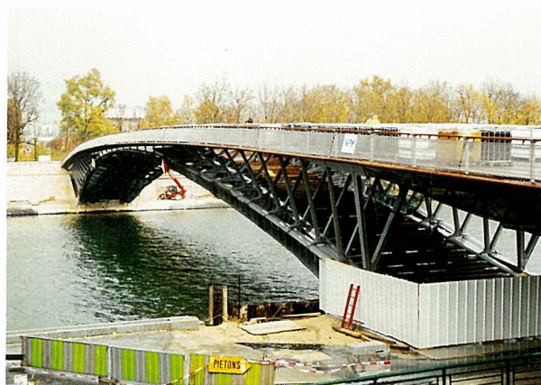
写真-1 ソルフェリーノ橋(パリ)