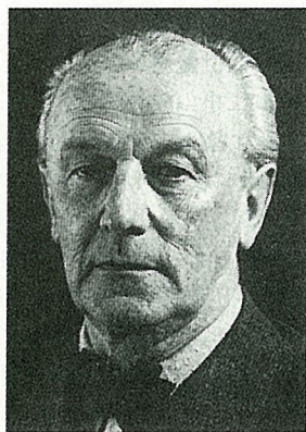
写真-4 パウル・ボナツ