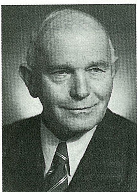
写真-5 カール・シェヒテル