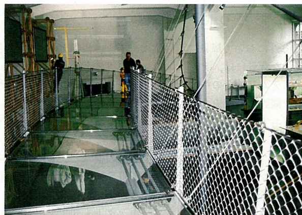
写真-12 ガラスの床版を有する歩道橋（ドイツ博物館）

メンは構造フォルムを考える場合、常に力の流れが明確であることを意識している。つまり、遠景から見た場合、桁を吊っている部材がはっきりと見えなければならないのである。しかし、エクストラドーズド橋の場合、桁を吊る