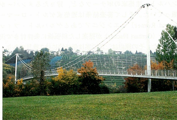
写真-9 マックス・アイゼーの歩道橋, 1989

スケープデザインを担当した造園家ハンス・ルッツ (Hans Luz) と共同で歩道橋のデザインを担当するが、その設計条件はたいへん厳しいものであった。とくにハイルブロンナー (Hailblonner) 通りの歩道橋のケーブルアンカーが鉄道の敷地内に設置されている点に注意していただきたい (写真-11)。部署間の調整が難しい日本では実現しにくい配置である。この事実はシュツットガルト市の都市計画課、公園課、道路課をはじめとする各部署が、シュライヒのデザインを実現するために、部署間の壁を超えて協力した証であり、シュライヒも前代未聞の歩道橋のデザインを企業者に理解してもらうためには、並々ならぬ時間を費やし、口角