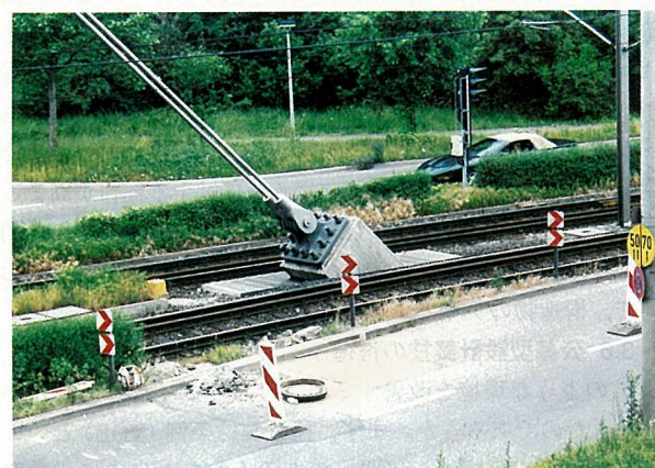
写真-11 斜材のアンカーが鉄道の敷地内に設置