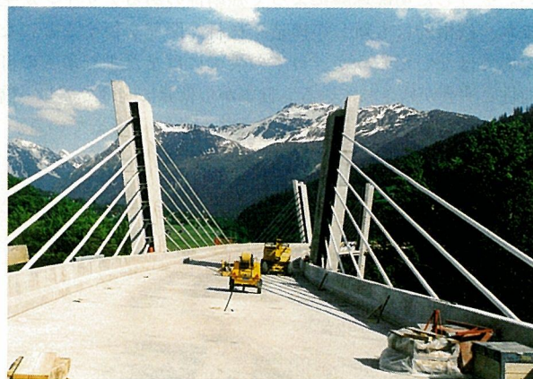
写真-13 ズンニベルク橋

部材がケーブルであるため、遠景からは主塔のみが強調されて奇異な印象を受ける。そこで、ズンニベルクでは斜材を白く塗って遠景からでも桁を吊っている状況が分かるようにしたいと考えた。デザイナーがある風景に相応しい橋梁フォルムを考える場合、ある特定な視点に立ってそこから橋をどのように見せるかを考える。これを仮にデザインの特異点とすると、たとえばガンター橋の特異点は、遠景にあったのではないだろうか。ズンニベルクにおいてもメンの特異点は遠景にあり、だからこそ斜材の色を白くすることによって、背景の緑の中で桁を吊る斜材を浮かび上がらせようと考えたのである。