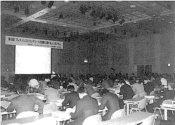
写真 - 5 一般講演風景

工期短縮やコスト縮減を目的としたプレキャスト床版の継手に関する発表が多かった。リップ付き床版や大容量プレテンション方式によりプレストレスを与えられた床版など新しい床版に関する発表もあり、活発な質疑が交わされた。