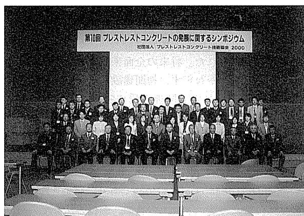
写真 - 6 運営に関わったメンバー

最後に、本シンポジウムの開催にご協力をいただいた兵庫県の関係各位、運営に際し適切な助言と多大なる努力をいただいた実行委員会、幹事会、PC建設業協会関西支部、同技術部会をはじめとする関係各位に深甚なる謝意を表し、本報告のまとめとする。