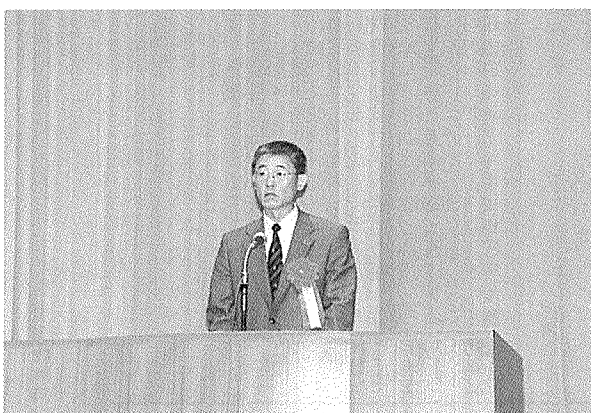
写真-2 吉野 広島県土木建築部長挨拶