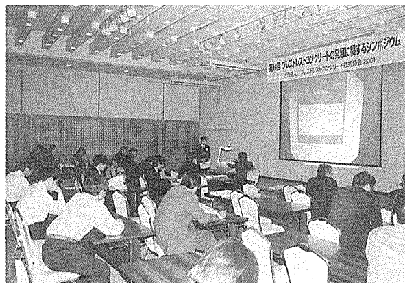
写真-5 セッション風景

湿気硬化型のプレグラウト樹脂や、超軽量・高性能軽量・高強度コンクリートを用いた研究・施工報告が多く、その他、アラミドメッシュを用いたひび割れ制御、非硬化型炭素繊維ケーブルについての研究報告もあり、活発な意見交換がなされた。