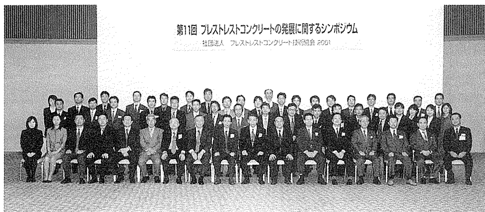
写真-6 運営に関わったメンバー