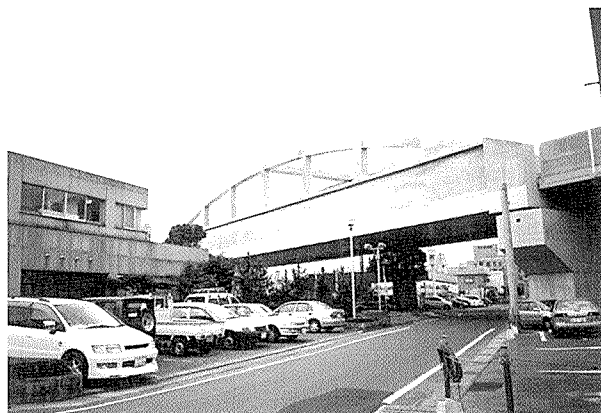
写真-2 PCランガー橋（九州新幹線原田架道橋）

ランガー桁の鉛直材は、引張部材であるため、鋼材を使用することも普通鉄道では行われている。