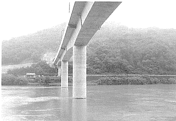
写真-3 PC ラーメン橋（九州新幹線球磨川橋梁）

鉄道橋は一般に橋脚の高さが低いため，連続桁橋として橋脚頭部に支承・ストッパーを設置した橋梁が多かったが，長野新幹線以降は可能な限りラーメン橋としている。ラーメン橋は耐震性に優れ，支承，ストッパー，支承点検足場，張出し架設時の仮固定装置が不要となるため経済的なだけでなく，保守点検作業も軽減できる利点がある。したがって，橋脚高が低い場合や，地盤が悪く橋脚間の不等沈下が懸念される場合は連続桁橋，その他の場合はラーメン橋が採用されている（写真-3）。