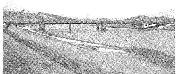
写真-6 PC 斜版橋 (九州新幹線川内川橋梁)

また、すでに道路橋で実績のあるスパン中央部を鋼構造とする複合構造も期待できる (写真-5)。