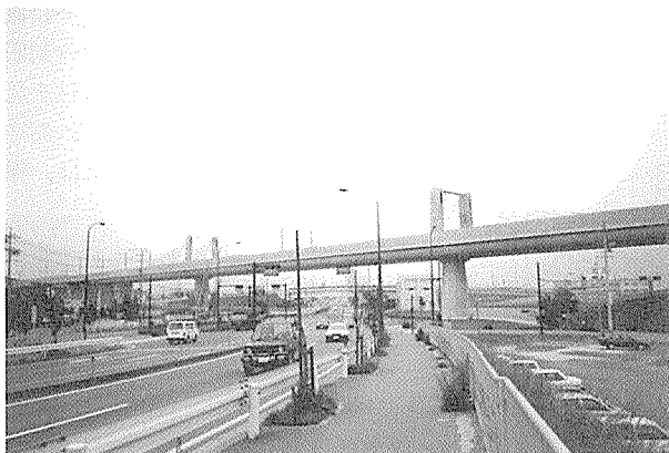
写真-5 エクストラードズド橋 (北陸新幹線屋代南架道橋)