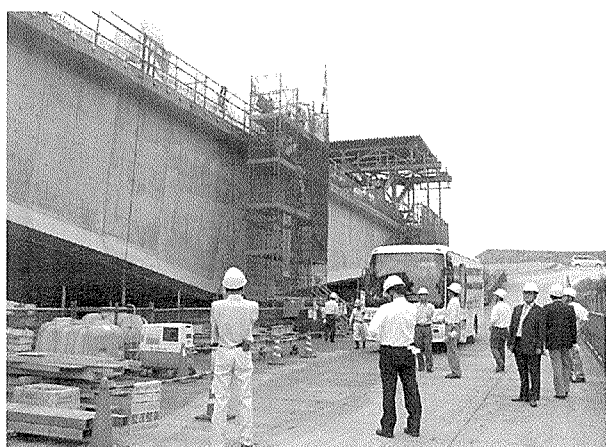
写真 - 4 張出し架設中の錐ヶ瀧橋上り線

打設・養生、⑥床版横締め・内ケーブルの緊張、というサイクルで作業が進められているそうです。見学させていただいた 8 ブロック目は、前述した①~④までの作業が完了し、コンクリートを打設する直前の状況でした。