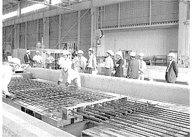
写真 - 2 プレテンションウェブの製作状況

で、見学の時点では、PC 鋼材の配置および鉄筋の組立作業が行なわれていました（写真 - 2）。