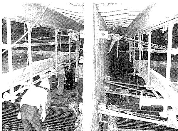
写真 - 3 プレテンションウェブの設置状況