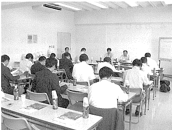
写真 - 1 全体説明の状況