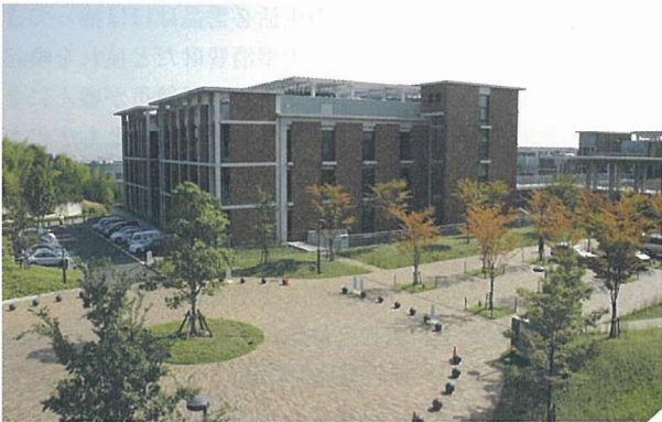
写真 - 4 電気・化学系入り口ロータリー