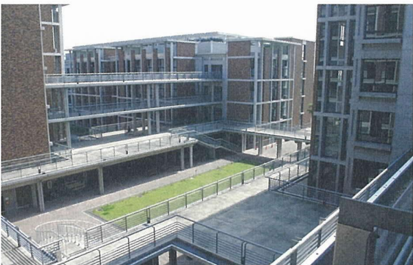
写真 - 5 電気・化学系中庭