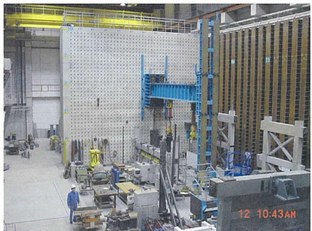
写真 - 9 建築学専攻 3次元構造材料実験室