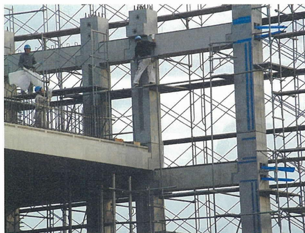
写真 - 2 建設中 2