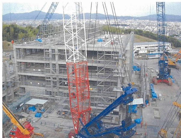
写真 - 1 建設中 1

写真 - 1 および写真 - 2 に建設中の様子を示す。写真 - 1 では、遠く比叡山と京都タワーを望む。写真 - 3 から写真 - 6 に電気・化学系建物を、写真 - 7 は、桂地区の中央 B クラスタにある事務棟から建築学専攻建物を望む。ここでは、圧縮強度 200 MPa の超高強度コンクリートを用いて建設されたモニュメントが右端に見える。写真 - 8 は建築学専攻建物で、写真 - 9 は、建築学専攻建物内にある 3 次元