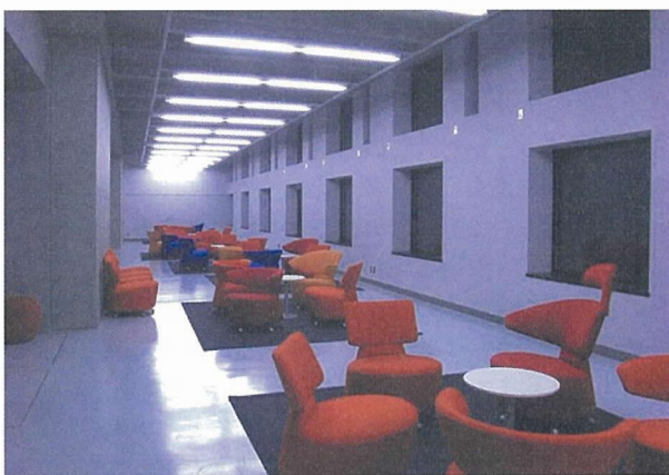
写真 - 6 学生ラウンジ

構造物実験室が示されている。これらの写真より、プレキャスト PC 構造の優れた創造性が理解でき、今後ともに大いに用いられていくことを信じている。また、今後学校建築に用いられる場合の参考になれば大いに喜びとするところである。