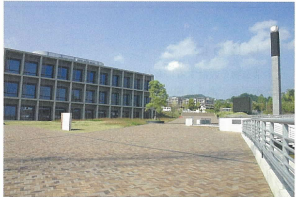
写真 - 7 桂事務棟から建築学専攻建物を望む

構造物実験室が示されている。これらの写真より、プレキャスト PC 構造の優れた創造性が理解でき、今後ともに大いに用いられていくことを信じている。また、今後学校建築に用いられる場合の参考になれば大いに喜びとするところである。