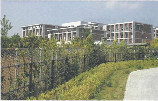
写真 - 3 電気・化学系建物南面