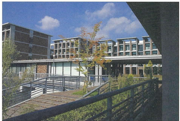
写真 - 8 建築学専攻建物南面