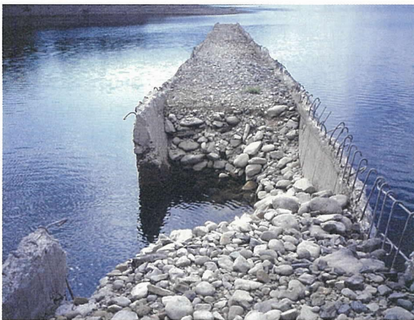
写真 - 3 一部崩落したタウシュベツ川橋梁 (2006年8月撮影)