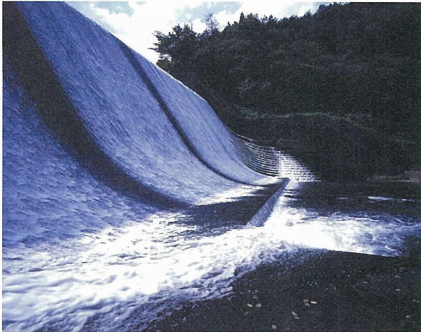
写真 - 1 白水堰堤