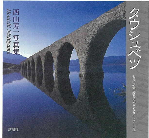
写真 - 2 写真集「タウシュベツ」大雪山の麓に眠る幻のコンクリートアーチ橋