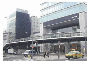
写真 - 7 シャープなエッジを見せるアキバ・ブリッジ

アキバ・ブリッジ (写真 - 7) は、狭い駅前広場で橋をどう美しく見せるかが課題であった。デザインのポイントは「スレンダー」、「ダイナミック」、「桁下空間のゆとり」の 3 点である。平面曲率 R = 170 \text{ m} と縦断曲率 R = 1100 \text{ m} を組合せると、橋が「ダイナミック (動的)」に見える。床版のエッジをシャープに見せるには、厚さ 350 mm の縦面に光を当てて強調し、床版下面にはストラットを使ってコンクリートの薄さを引き立てる。さらに高欄に笠木のない強化ガラスを使うと、エッジの曲線が強調される。桁は 120 \text{ N/mm}^2 の超高強度コンクリートにより格段にスレンダーとなり、桁高 1.2 m でスパン 33 m (スパン桁高比 = 27.5 : 1) を飛ばすことができた。全幅 9.15 m の床版もストラット構造によって Y 字脚頭部を 3.75 m に抑え、橋脚幅も 2 m に絞ることにより、桁下空間にゆとりが生まれた。固有振動の問題は、アプローチデッキの接続によって解決している。一方、反力分散沓が予想外に大きく、V カットした Y 字橋脚にできなかったのはやや心残りではあった (写真 - 8)。コンクリート技術者、構造設計者、建築家そして施工者、彼らとの家族の絆にも似た連携がこの橋を実現させたのだと思う。新材料+新技術とデザインを組合せると、世界に負けないオリジナルな橋が実現できる。それが日本の PC 橋の未来を担うのではないだろうか。