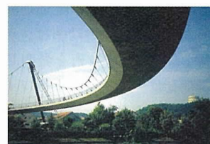
写真-2 ケルハイムの歩道橋（1987年）