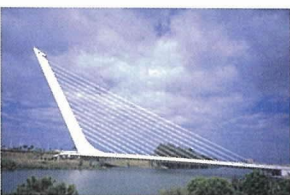
写真 - 5 アラミージョ橋 (1992 年)

1990 年当時、ミュンヘン工科大学には、PC 斜張橋の実ケーブル用疲労試験機があり、カラトラバのデザインしたアラミージョ橋 (写真 - 5) に使われる PC 斜材の疲労試験を実施していた。実験担当は、フィンスターバルダー (Finsterwalder) の愛弟子であり、アイデアの実現に貢献したミュラー技師 (H.H.Mueller) (写真 - 6) である。フィンスターバルダーの功績は、ディビダーク工法を始めとするかずかずの PC 技術を発明しただけではなく、ハンブルクにあるケールブランドヘフト橋やベネズエラのマラカイボ橋、英国のセバーン橋における PC ケーブル腐食の問題に対して、曲げの影響を考慮した実ケーブルによる疲労試験の必要性を説いたことである。1988 年に PC 界の巨匠が他界された後も、ミュラー技師は世界の PC 斜張橋の実ケーブル疲労試験を担当された。エポキシ樹脂といえども、クインシー橋のように 7 本鋼より線の外側だけにコーティングした PC ケーブルでは、腐食によって破断する危険性が高い。実験結果に対してつねに真摯である姿勢が、ドイツにおける PC 技術の開発に、同大学が中心的な役割を果たす原動力になっていた。フィンスターバルダーの人柄について話を伺うと、「どんな人に会っても、つねに腰が低く、たとえ実験結果が悪くても決して諦めることはなかった」と、彼の物真似をしながら語った。巨匠の意思は、その面影を語る後継者の血管の中から滲み出るほどに、しっかり