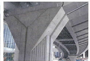
写真 - 8 アウトケーブル＋ストラット構造のデッキ