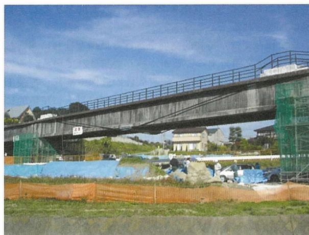
写真 - 2 外ケーブルによる補強

既存構造物の維持管理・補修・補強は、RC だけでなく PC の構造物でも、大きな技術開発の場である。現在、診断・補修・補強の実施で求められているのは、写真 - 2 に示すように、構造技術に裏付けのされた事例が多い。しかしながら、適用例が多い外ケーブルのプレストレスを導入する事例では、構造的な裏付けなしに補強しようとして安全性を低下させているケースが多々ある。このような事例が、今後も増えてくることは危惧されている。