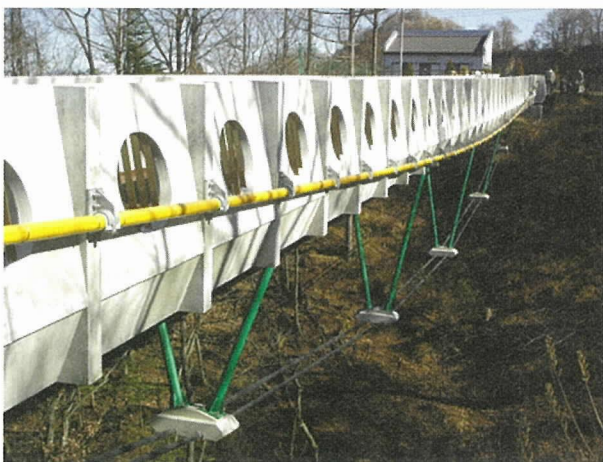
写真 - 1 青春橋

青春橋は、わが国で当時は珍しかった公募方式の「設計施工一括発注方式」で造られた歩道橋であることも、受賞に対して評価された (写真 - 1)。すなわち、受注者の選定、橋梁形式と架設方法などの決定を、公募による技術提案を通じて行ったことが高く評価された。これらの決定は総合評価方式により行われ、受注者とは「設計施工一括発注方式」により契約を締結された。そして、これら一連の事務の執行については、(財)群馬県建設技術センターが建設マネジメント業務の一環として、婦恋村より受託して実施した点が、高く評価された。10 案の技術提案がなされ、7 名の審査員で構成された審査委員会において、提案者による提案内容の説明の後、各委員から提案者に対するヒアリングを行った。審査の点数配分は、経済性が 35 %、構造性が