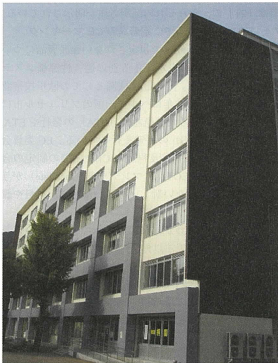
写真-4 建物の耐震補強例

れを制御して耐久性を向上させることの相反する要求性能を同時に満足させている。このような試みにも注目したい 3,4) 。