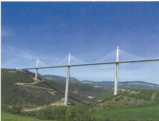
写真-3 タルン川渡河部のミヨー高架橋の橋脚、主塔、斜材 4)

逆にプレストレスを導入することで、地震力による変形(変位)を制御し、地震の影響を低減できる利点がある。地震のエネルギーを吸収して、耐震性を高めるこのようなPC技術が注目され、受注が増えている。写真-3に示すフランスのミヨー高架橋では、その高橋脚の上部100m区間にPCを導入して、橋脚の可撓性を向上させることと、ひび割