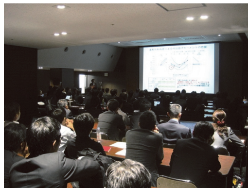
写真 - 8 セッション会場風景 1

最後に、座長から次回のシンポジウムでは建築も容器もより多くの論文・報告を投稿して、それぞれ独立したセッションを運営できるようにしたい、との期待を込めた参加者へのお願いで締めくくられた。