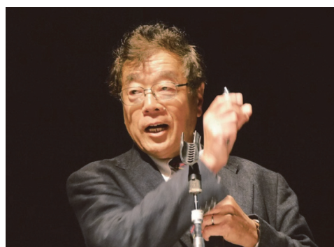
写真 - 5 藤野陽三 横浜国立大学 先端科学高等研究院 首席特別教授 (特任) 特別講演 II

その他の応用例として、魚養殖場、浮き波止場、海上スポーツ施設、海上集合住宅などの構想や実例が示された。それらは、単なる夢物語ではなく、これまでの大型海上構造物建設の経験と、構造、建築、静的および動的流体力学、浮力といった工学的な裏付けによるものであった。