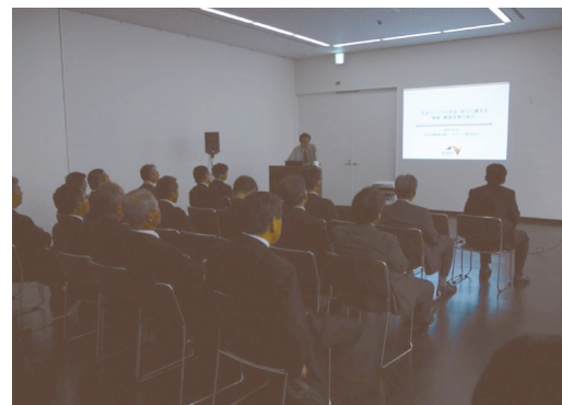
写真 - 7 技術展示出展者による技術紹介