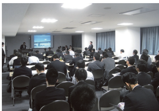
写真 - 9 セッション会場風景 2

発表後は、新工法の疲労試験に水漏れを考慮しているかといった質問や、施工報告においても、場所打ち部分の耐久性確保の工夫に関する質疑応答など、全体的に耐久性の重要性が注目されていた。講演中は、立ち見の方がでるほど、多くの聴講者が来場し、注目の高さがうかがわれた。