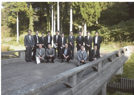
写真 - 10 シンポジウム関連現場視察