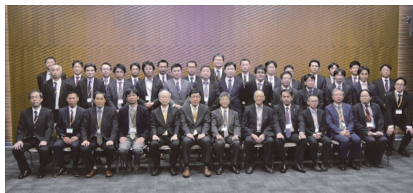
写真 - 12 シンポジウム運営関係者

また、シンポジウムの運営にご尽力いただいた実行委員会、幹事会、論文審査部会、総務 WG、広報 WG、学術 WG、現地 WG、プレストレスト・コンクリート建設業協会の関係各位に謝意を表し、本報告を終える。