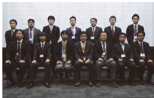
写真 - 11 優秀講演賞受賞者

受賞者の対象は、投稿時に 50 歳未満の正会員で、論文や報告の内容、講演や質疑が簡潔明瞭で優れた方とし、各