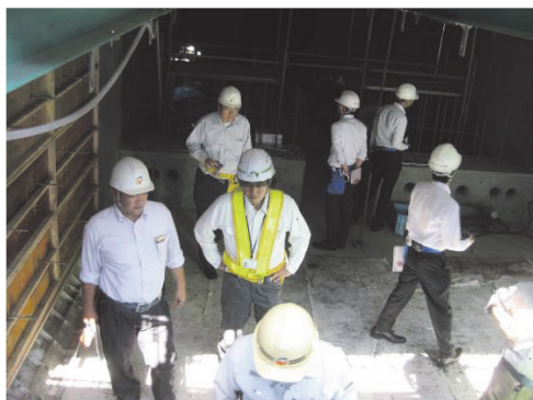
写真 - 5 P3 張出し施工部での主桁内見学状況

編集委員会の一行もこの道路を利用して見学現場にきましたが市内を抜けるとこの道路からは朝里川橋を目にすることができます。そのため市民のみならず観光客にも非常に印象に残る橋梁であり今後も無事故で無事工事が竣工し、地元の方々からも愛される橋梁となることを願います。