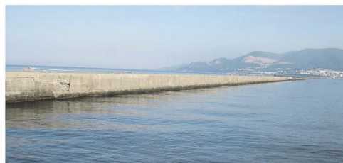
写真 - 7 小樽港北防波堤

コンクリートブロックの積み方だけでなく、北防波堤ではブロックの耐海水性を高めることとブロック製作費の低減を目的に火山灰を混入したブロックの製作も実施してい