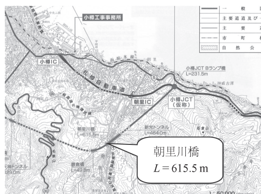
図 - 1 橋梁位置図

横断自動車道余市～小樽 JCT 区間の一部を構成する橋長 615.5 m の PRC 8 径間連続ラーメン箱桁橋です（図 - 2）。発注者は東日本高速道路（株）北海道支社で、施工者は（株）ピーエス三菱であります。同橋は二級河川朝里川と普通河川矢別川、主要道道小樽定山溪線および 3 本の市道を横過している交差条件の厳しい橋梁であり、施工方法は主に張出し架設工法が用いられており、側径間の一部に支保工施工が計画されております。最大支間は P5～P6 径間の 103.0 m であり最大桁高は P6 柱頭部で 7.0 m を有しております。橋脚は RC 構造で最大高さ 43.5 m を有し、基礎工には杭