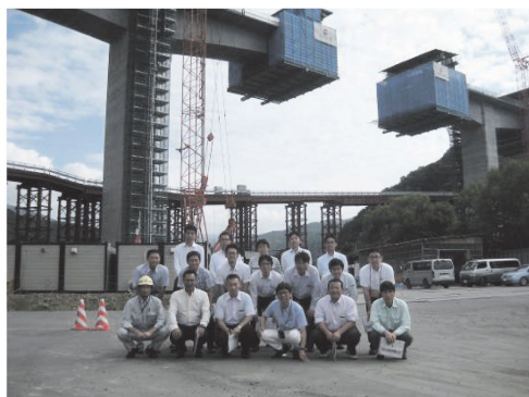
写真 - 6 参加者による集合写真

編集委員会の一行もこの道路を利用して見学現場にきましたが市内を抜けるとこの道路からは朝里川橋を目にすることができます。そのため市民のみならず観光客にも非常に印象に残る橋梁であり今後も無事故で無事工事が竣工し、地元の方々からも愛される橋梁となることを願います。