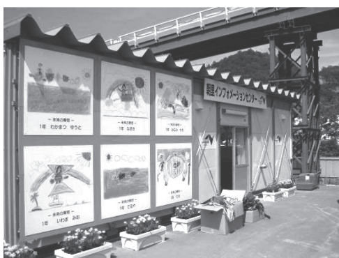
写真 - 1 朝里インフォメーションセンター

見学会参加者はバスで現地に到着したのち、はじめに発注者である東日本高速道路(株)が P3 橋脚の近くに設けた朝里インフォメーションセンターに案内されました(写真 - 1)。同施設は外壁一面に地元小学生の絵が飾られております。施設内部では朝里川橋で用いられているプレストレストコンクリート技術のみならず北海道横断自動車道余市～小樽の事業概要が展示されており、当該地域の地質などの資料も豊富であるため、橋梁のみならず本事業におけるトンネル工事や土工の特徴などが分かるようになっておりました。また同施設の前には朝里川橋の橋脚工において配筋の施工性などを検討した実物大のモデルが展示されており一般人でも構造物に用いられている材料やその大きさなどが理解できるように工夫されておりました。