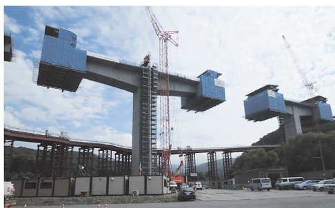
写真 - 4 P3 橋脚 (左) と P2 橋脚 (右) の工事状況