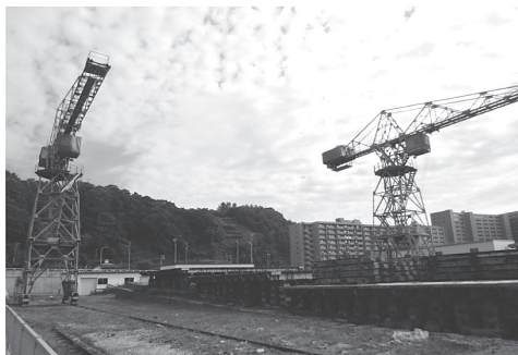
写真 - 10 斜路式ケーソン製作ヤード

技術者として画期的な発想と改善を重ね続けて課題を解決し北海道の港湾建設に多大な貢献を残した伊藤長右衛門の遺骨の一部は遺言により北防波堤の先端に埋葬されているそうです。そのような姿勢に心撃たれるものを感じずにはいられませんでした。