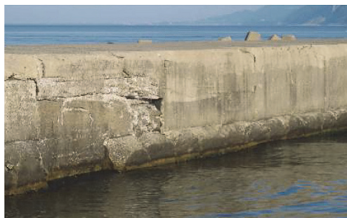
写真 - 8 傾斜しているブロック (右下段部)