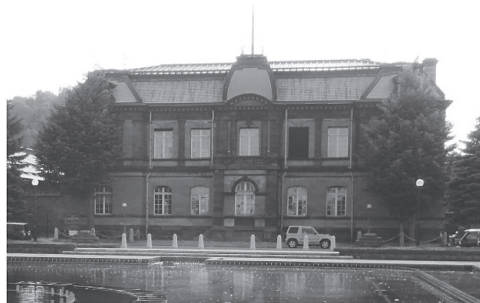
写真 - 11 建物外観

なお、この建物は明治 39 年 11 月に 2 階会議室で日露戦争後、樺太の日露国境画定会議が行われた歴史的建物でもあります。また、会議終了後、隣の貴賓室で祝盃が交わされたという歴史的遺構でもあります。