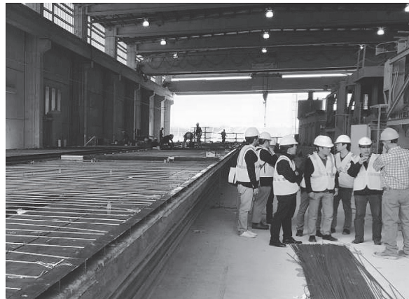
写真 - 4 製造ラインの見学状況

の刑務所独房ユニットや階段などの型枠も見学した。階段は、踊り場付で、蹴上と踏面の高さにより角度調整が可能となっている。コンクリートプラントの製造能力は 380 m 3 /日で、製作されたプレキャスト版をタイヤ式門形クレーンで移動するさまは、写真 - 5 に示す人物とタイヤを比べても、米国ならではのスケールの大きさを感じとれる。