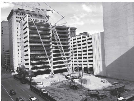
写真 - 7 プレキャスト構造の駐車場工事現場

ヒューストン市街地にある、駐車場の工事現場を見学した。14 階建てのアメリカ国内でも最大級の駐車場で、柱・梁・壁・床・階段をプレキャスト化したオールプレキャスト構造である。構造は、柱に軸力のみ負担させ、柱脚をボルトによるピン支持とし、XY 方向とも耐震壁によって水平力を負担させるシステムである。耐震壁は、V ポケットと呼ばれるシアキーと、モルタル充填式機械式継手を併用して接合されている。建方は、クレーンを後退させる建て逃げ方式で、1 スパンごとに組み上げられている（写真 - 7）。