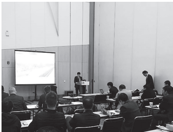
写真 - 2 発表の様子

材に対し、数多くの質問があり、セッション終了時には個別に意見交換を交わすシーンも見られ、日本の最新技術に大きな関心を寄せていることがうかがえた。また、講演当日の夜には、 fib Commission 6 のメンバーと Japan Session 講演者を招いた CEG 社（米国のプレキャストコンクリート専門の構造設計およびコンサルタント会社）主催の懇親会が開催され、各国の技術者達と大いに親睦を深めた。