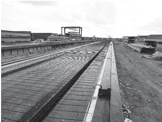
写真 - 6 Double Tee スラブ専用ベッド

2 300 m 2 の DT 版を製造しているとのことであった（写真 - 6）。