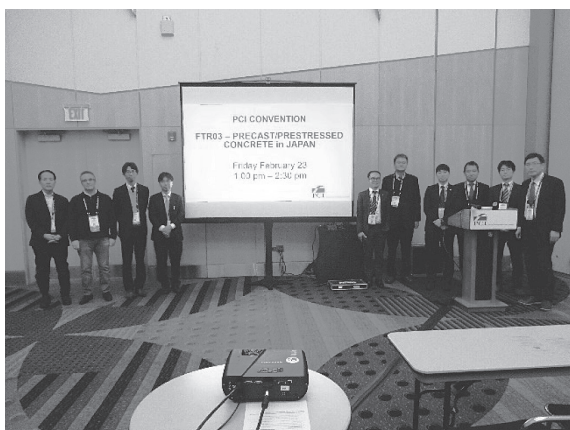
写真 - 3 発表会場にて