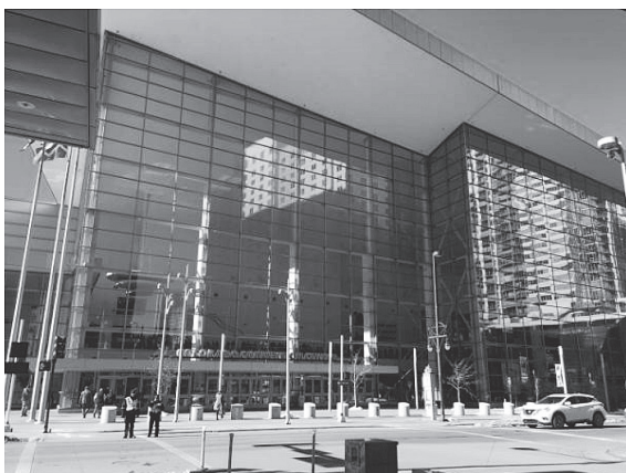
写真 - 1 会場の Colorado Convention Center

コンベンションは、米国コロラド州デンバーの Colorado Convention Center にて、PCI Convention & National bridge conference と題し開催された (写真 - 1)。PCI Convention は今年で63回目の開催となり、コンベンションと並行して同会場で、プレキャスト業界の関係者による大規模展示会である THE PRECAST SHOW が催された。