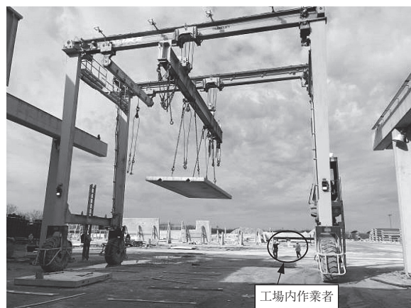
写真 - 5 プレキャスト版を移動するクレーン