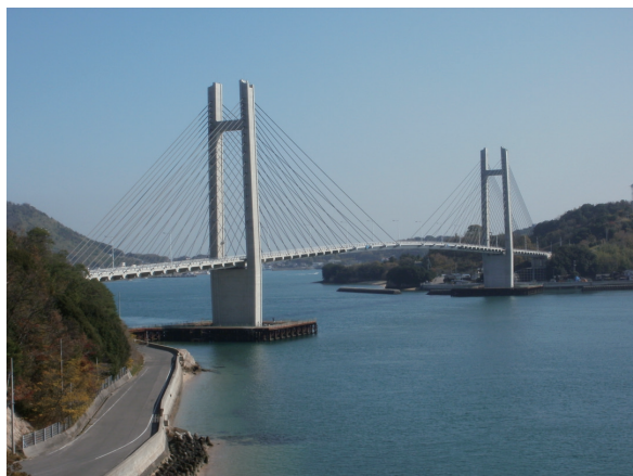
写真 - 11 複合斜張橋（生名橋）