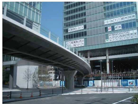
写真 - 12 UFC 橋梁（アキバブリッジ）