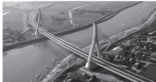
写真 - 8 PC 斜張橋（矢部川橋）

また、斜材の分担度合いを下げ、梁の剛性を上げて主桁により多く分担させる形式がエクストラード橋と呼ばれています（写真 - 9）。この構造形式はわが国で開発されたもので、桁橋と斜張橋における適用支間の中間規模橋梁において、現在では世界中で採用実績を伸ばしています。