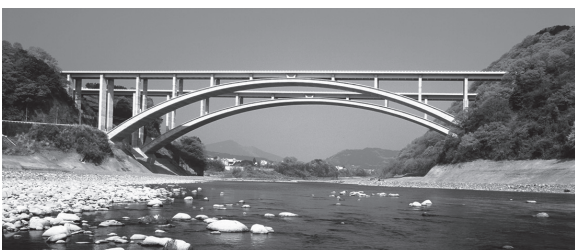
写真 - 7 アーチ橋（富士川橋）

梁の形状を上向きの曲線（アーチ）とすることにより、上載荷重によって梁に作用する断面力は軸圧縮力が卓越し、曲げモーメントを桁橋より低減できます。このことで、支間長の増大が可能になります。アーチは曲線形状のため、車両等の路盤として直接使用することは困難です。このため、アーチ上に支柱を立てるか（上路式）、鉛直材を吊り下げて（下路式）路盤部材を支持する構造が大半です。圧縮に強いコンクリートに有利な構造で多数の実績があり、国内では最大アーチ支間 250 m を有した橋梁（写真 - 7）もあります。