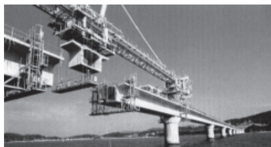
写真-4 エレクションガーダー架設

プレキャストセグメントの架設方法には、片持ち架設やスパンバイスパン架設などがあります。エレクションガーダーという架設機材を使った事例を写真-4に示します。このときは、海上だったので、セグメントは架設済みの主桁の上にレールを敷いて移動させました。