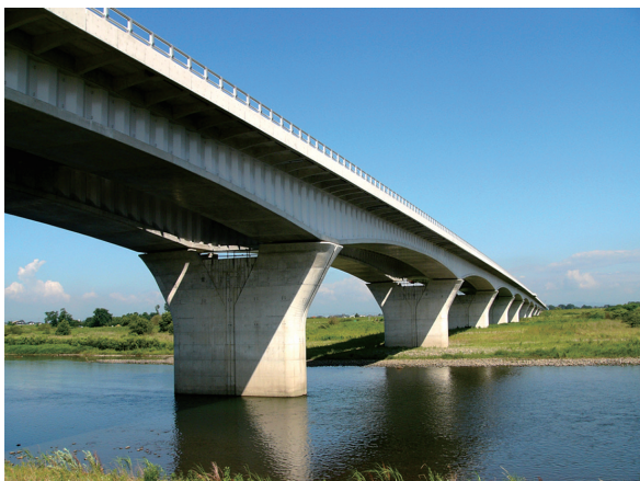
写真 - 10 波形鋼板ウェブ橋（鬼怒川橋）