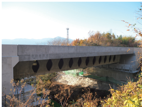
写真 - 13 Dura-Bridge（別楚谷橋）