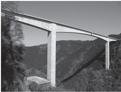
写真 - 6 桁橋（新旅足橋）

上載荷重に対して、梁部材のみで抵抗する構造です。この梁部材を下部構造に載せただけの橋梁形式が桁橋となります。桁のみで抵抗させるため、上載荷重や支間長が大きくなると、発生する曲げモーメントに応じて桁断面の高さ（桁高）や部材厚も大きくなります。橋梁でもっとも多い一般的な構造形式であり、比較的支間の短い橋に採用されますが、200 m を超える長大支間を有する実績（写真 - 6）もあります。