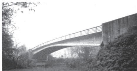
写真 - 1 マルヌ川 5 橋（ユスイー橋）

ポータルフレームの原理により支間中央の曲げモーメントを減少させることで，単純桁ながら支間長 74 m で支間中央桁高を 2.4 m に絞っており，写真 - 1 のようにスレンダーな形状です。